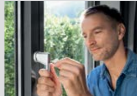
Als een raamgreep afgesloten is, maakt dit het voor inbrekers moeilijker om na glasbreuk de greep van buitenaf te bedienen.