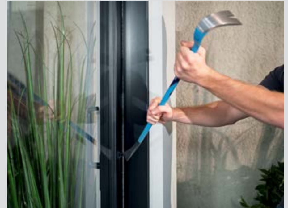
Bij Schüco is veiligheid meer dan een gevoel, het is een gecertificeerde zekerheid. Ongenodigde gasten blijven buiten.